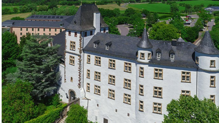
Victor's Residenz-Hotel Schloss Berg in Nennig

Ein Stück saarabwärts können wir einen Zwischenstopp im Victor's Residenz-Hotel Saarlouis einlegen. In diesem