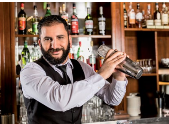
Drink gefällig? Die Victor’s Gruppe bietet eine Vielzahl interessanter Arbeitsplätze

Das Modell wird im Saarland in der Victor’s Residenz Saarlouis genauso praktiziert: Mit dem Hotel in direkter Nachbarschaft, und dem ambulanten Dienst „Medicus“ wird den Bewohnern der Residenz ein Stück Selbstbestimmtheit und zusätzliche Lebensqualität gegeben, die sie woanders nicht finden.