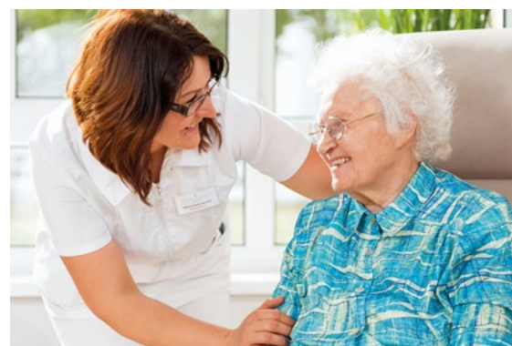
Pflege mit Herz: Die 120 Senioren-Einrichtungen der Victor’s Gruppe bieten sichere Arbeitsplätze und gute Aufstiegs-Chancen

Kontinuität wird großgeschrieben und das Wissen und die Erfahrung der Beschäftigten hoch geschätzt. Deshalb sind nicht Wenige schon ihr ganzes Berufsleben bei Victor’s. Sie, aber auch die vielen jungen, ebenfalls bestens ausgebildeten Kolleginnen und Kollegen, prägen ganz entscheidend die familiäre Unternehmenskultur. Neue Mitarbeiter können sich direkt wohlfühlen und von den Besten lernen. So führt der Weg in eine berufliche Zukunft, die große Chancen eröffnet und zufrieden macht.